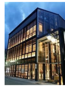
④総湯「湯めどころ宇奈月」